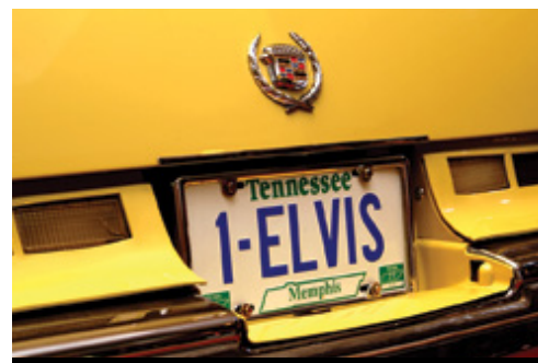
photo: New York—Central Park in autunno Memphis—La targa di una Cadillac