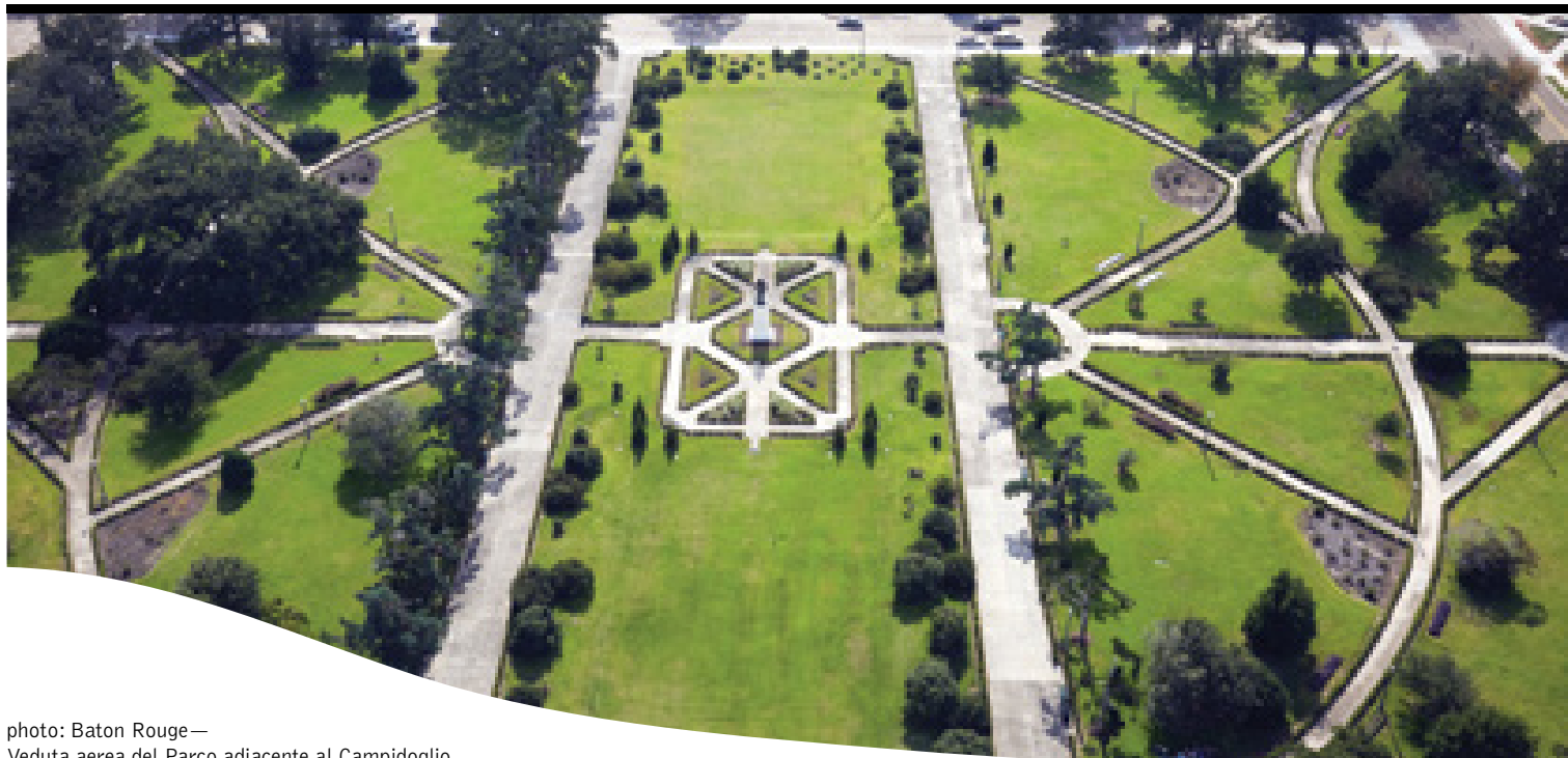
photo: Baton Rouge— Veduta aerea del Parco adiacente al Campidoglio

12 giorni / 11 notti. Da giugno a settembre. Inizio/Fine tour: New York/New Orleans