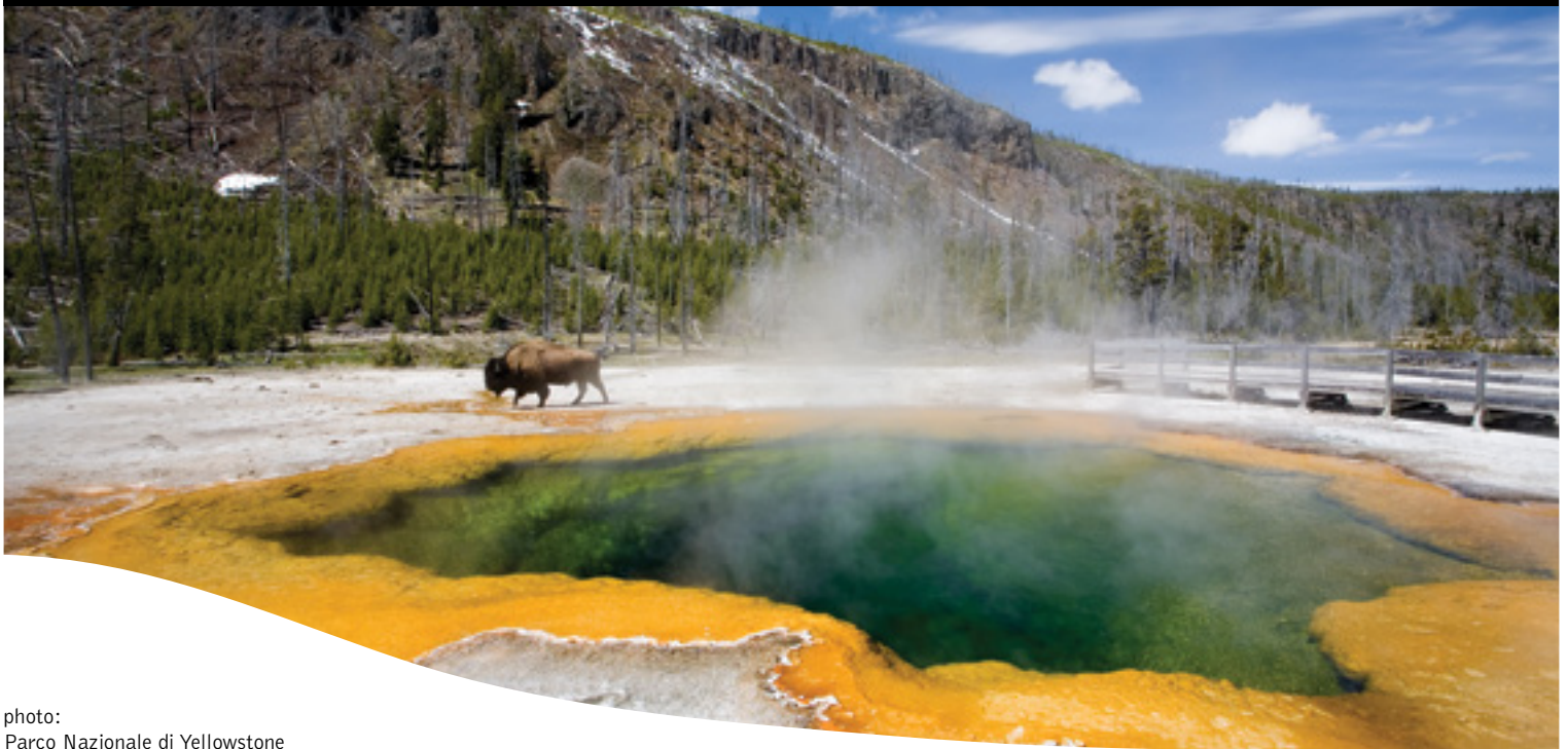
photo: Parco Nazionale di Yellowstone

15 giorni/14 notti. Da giugno ad agosto. Inizio/Fine tour: Denver