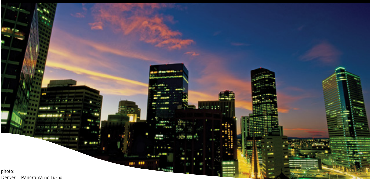
photo: Denver — Panorama notturno

13 giorni / 12 notti. Da giugno a settembre. Inizio/Fine tour: denver