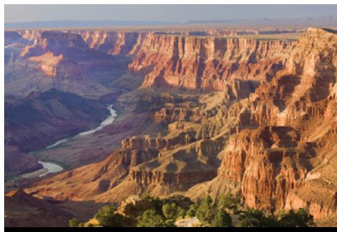
photo: Parco Nazionale di Monument Valley Parco Nazionale del Grand Canyon—Panorama