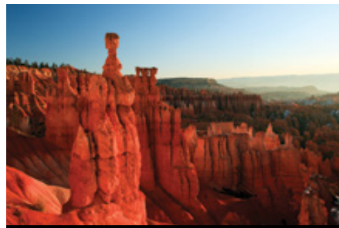
photo: Las Vegas— Panorama Parco Nazionale del Bryce Canyon— Panorama

la visita del Parco Nazionale di Arches, la più grande collezione al mondo di archi naturali. All'interno dei 76,518 acri del Parco sono conservati più di 2000 archi oltre a un'incredibile varietà di altre formazioni geologiche. Massicci, rocce, pinnacoli e guglie svettano maestosi sui visitatori intenti a esplorare il Parco dai più svariati punti di vista. Il più famoso degli archi è il Delicate Arch: per ammirarlo dovrete lasciare la strada principale e scendere per un sentiero. Durante la visita vi imbatteverete probabilmente in piccoli branchi di pecore bighorn, il cui colore del manto permette loro di mimetizzarsi col paesaggio. Al termine della visita proseguiamo per Moab, dove è previsto il pernottamento.