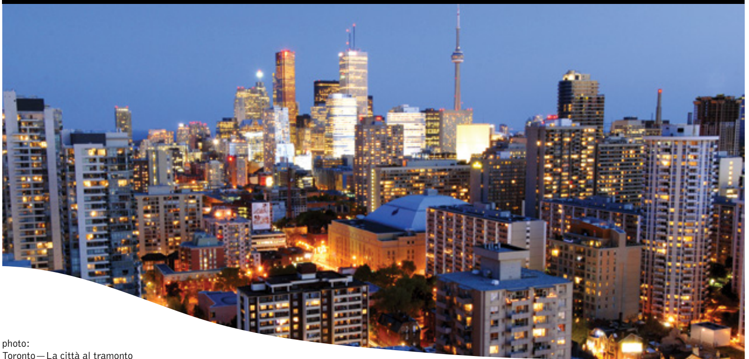
photo: Toronto—La città al tramonto

10 giorni / 9 notti. Da maggio a ottobre. Inizio/Fine tour: New York