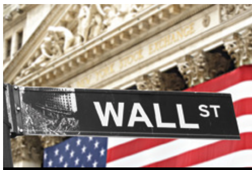
photo: New York, NY—Times Square New York—Wall Street