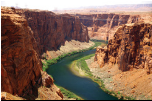
Parco Nazionale del Grand Canyon—Panorama