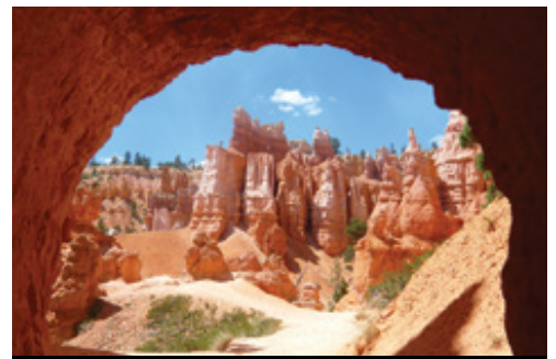
photo: Parco Nazionale di Monument Valley Parco Nazionale del Bryce Canyon