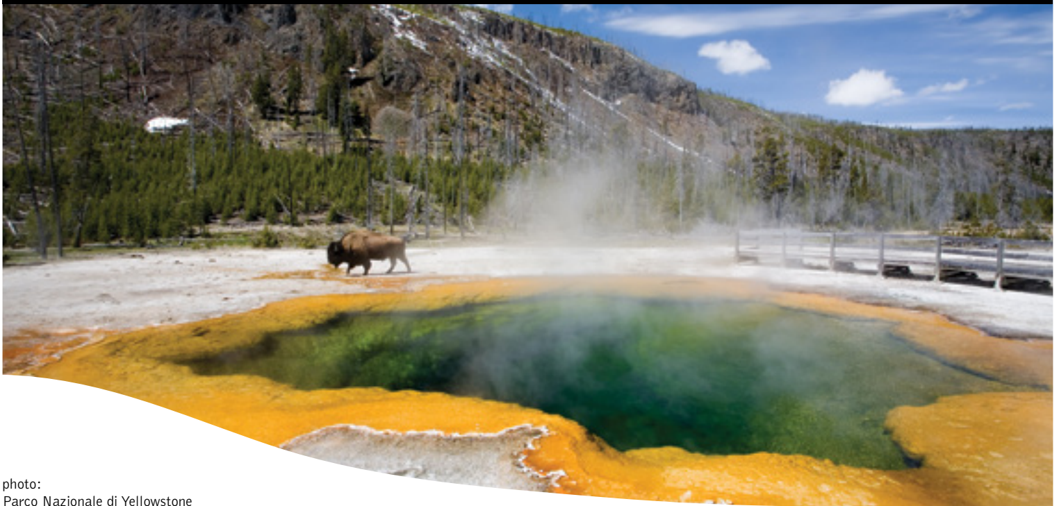
photo: Parco Nazionale di Yellowstone

15 giorni/14 notti. Da giugno ad agosto. Inizio/Fine tour: Denver