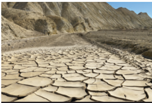
photo: San Francisco—Il Golden Gate Bridge Parco Nazionale di Monument Valley