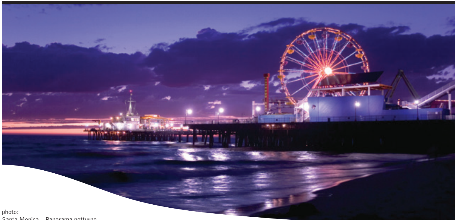
photo: Santa Monica—Panorama notturno

11 giorni / 10 notti. Da aprile a ottobre. Inizio/Fine tour: Los Angeles/San Francisco