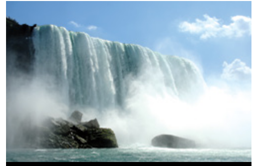
photo: Cascate del Niagara, NY

Tariffe aeree nazionali / internazionali; Quota d'iscrizione € 60 (ne vengono applicate massimo 2 per camera); Assicurazione annullamento facoltativa Base 3,5%; Assicurazione annullamento facoltativa All Risk 6%; I pasti, le bevande, gli extra in genere, le mance e tutto quanto non espressamente indicato nel programma; Spese personali come lavanderia, telefonate, escursioni facoltative.