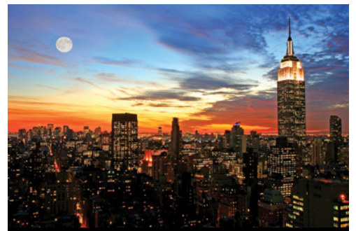
photo: Boston—Le tipiche architetture della città New York—Panorama al tramonto