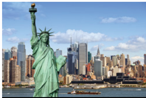
photo: Cascate del Niagara— La Horseshoe Fall New York—Il porto e, in primo piano, Lady Liberty