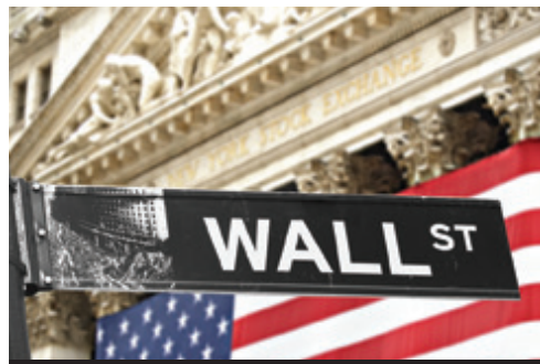
photo: New York—Il Charging Bull New York—Wall Street