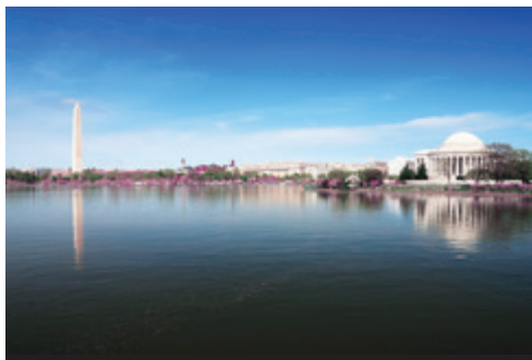
photo: New York—Panorama dei grattacieli Washington—Il Jefferson Memorial