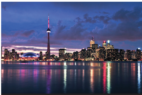
photo: Toronto—La skyline illuminata al tramonto San Francisco—Un caratteristico tram