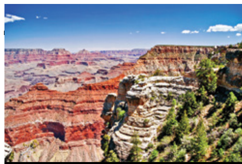
photo: Parco Nazionale del Grand Canyon—Panorama San Francisco—Panorama