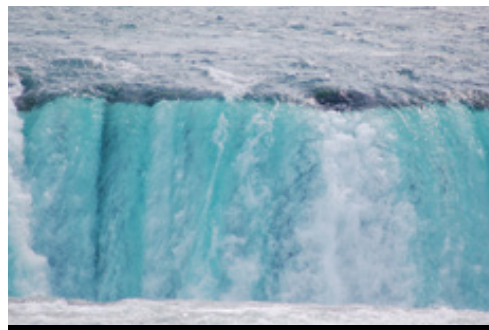
photo: Cascate del Niagara