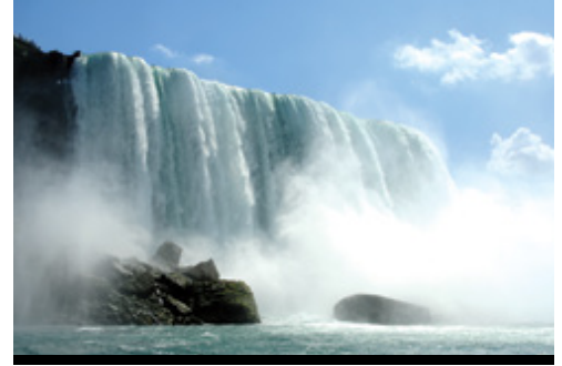
photo: Cascate del Niagara, NY

Tariffe aeree nazionali / internazionali; Quota d'iscrizione € 60 (ne vengono applicate massimo 2 per camera); Assicurazione facoltativa medica con massimale per € 1.000.000 a passeggero ed annullamento viaggio (da calcolare sul 4,5% del costo del viaggio); Costi di servizio hotel New York $ 15,00 a persona da pagare in loco; I pasti, le bevande, gli extra in genere, le mance e tutto quanto non espressamente indicato nel programma; Spese personali come lavanderia, telefonate, escursioni facoltative.