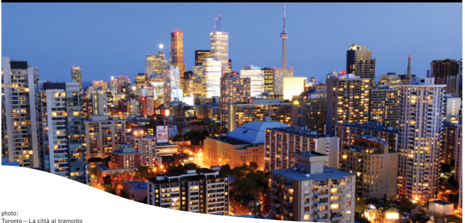
photo: Toronto — La città al tramonto

10 giorni / 9 notti. Da aprile a ottobre. Inizio/Fine tour: New York