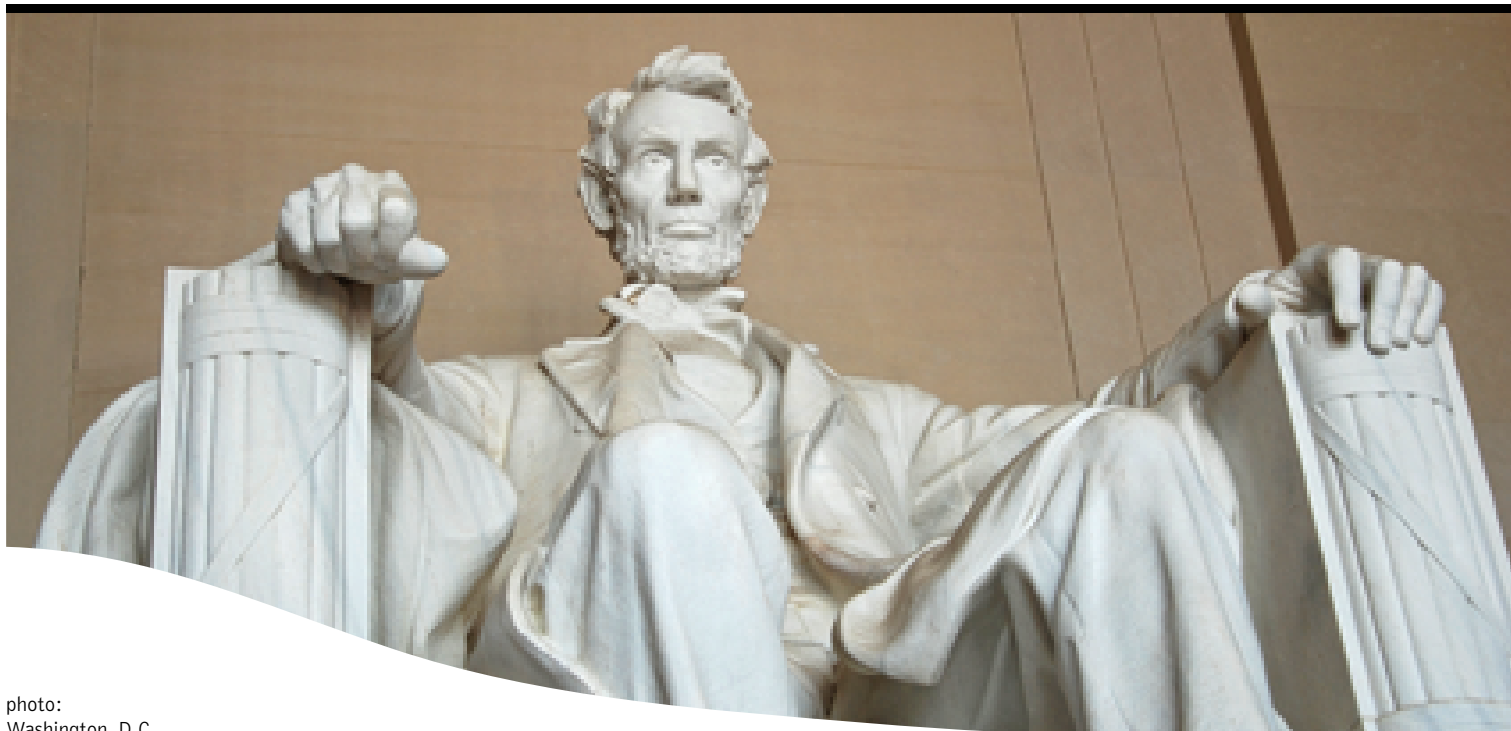
photo: Washington, D.C.

11 giorni / 10 notti. Da aprile a ottobre. Inizio/Fine tour: New York