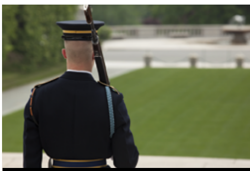
photo: Washington—Il Campidoglio Washington—Il cimitero di Arlington