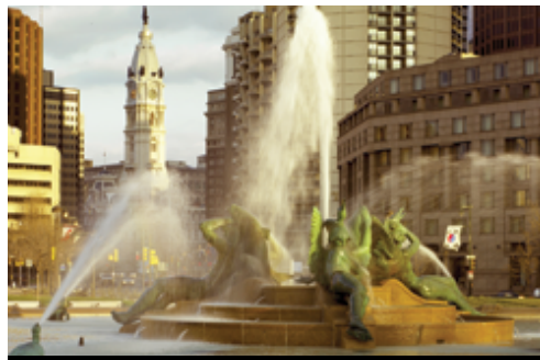
photo: Washington, D.C.—Il Campidoglio Philadelphì—La Swann Memorial Fountain