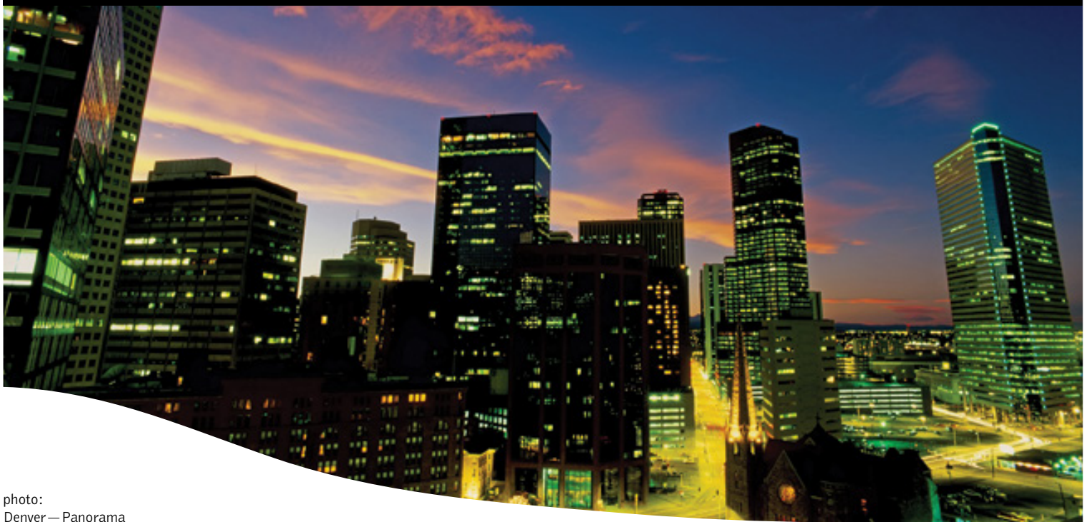
photo: Denver — Panorama

15 giorni / 14 notti. Da giugno a settembre. Inizio/Fine tour: Denver