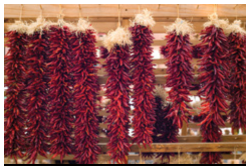
photo: Parco Nazionale di Mesa Verde Santa Fe—Trecce di peperoncini piccanti