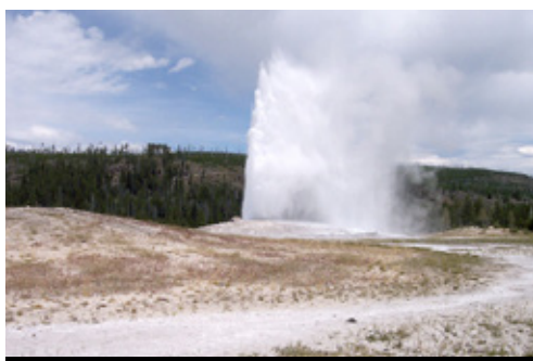
photo: Mt Rushmore—I quattro Presidenti Parco Nazionale di Yellowstone