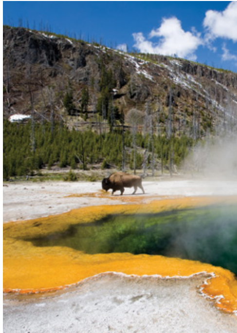
photo: Parco Nazionale di Yellowstone

Colazione continentale. Al mattino visita orientativa