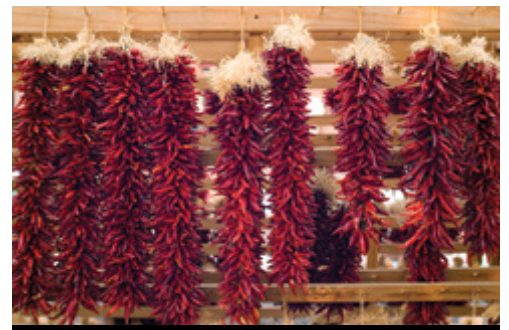
photo: Parco Nazionale di Mesa Verde Santa Fe—Trecce di peperoncini piccanti