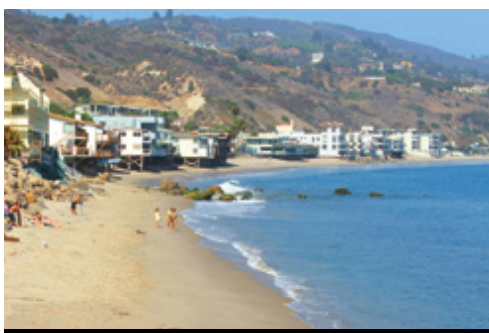
photo: Las Vegas— Panorama notturno Los Angeles— La spiaggia di Malibu