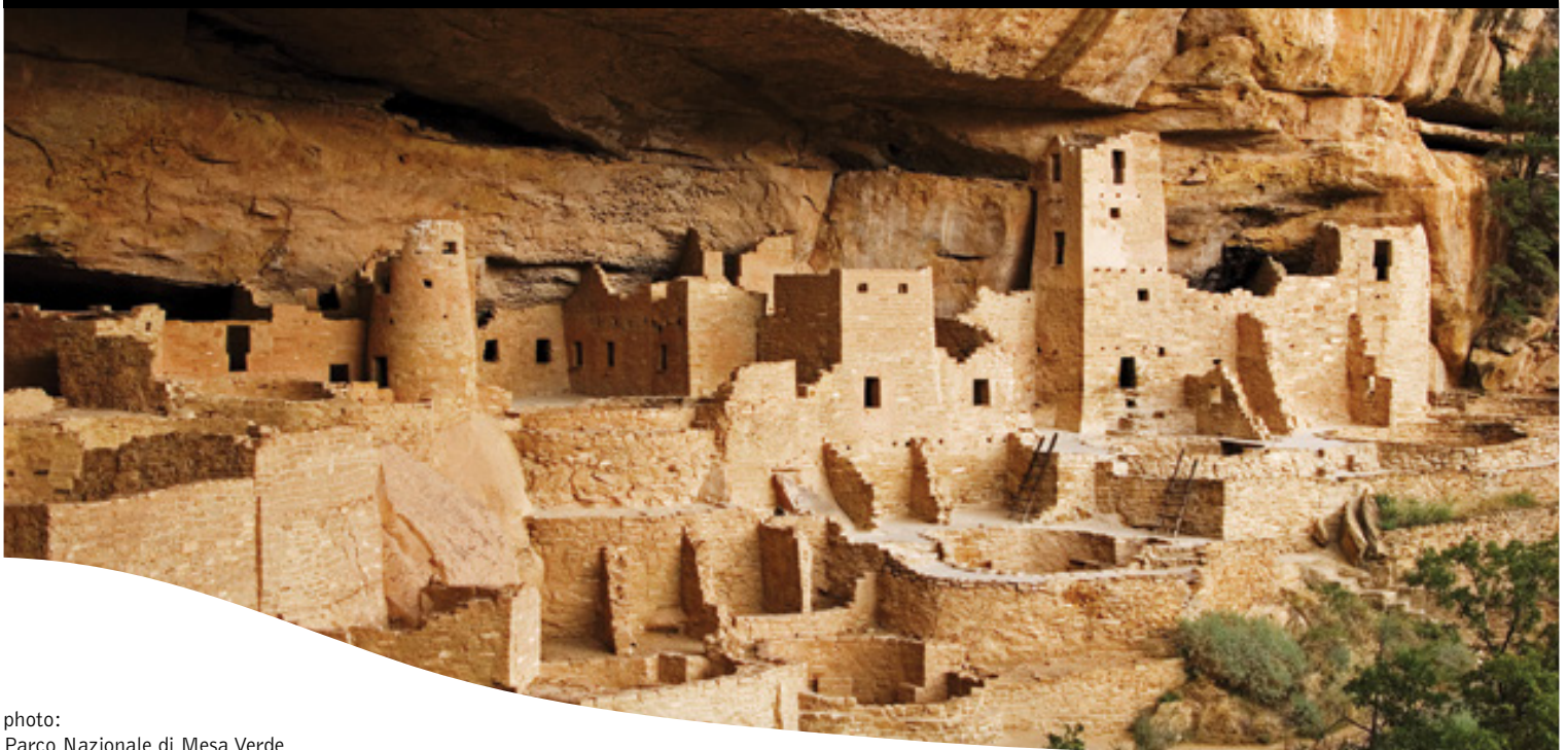
photo: Parco Nazionale di Mesa Verde

9 giorni /8 notti. Da giugno a settembre. Inizio/Fine tour: Los Angeles/Las Vegas